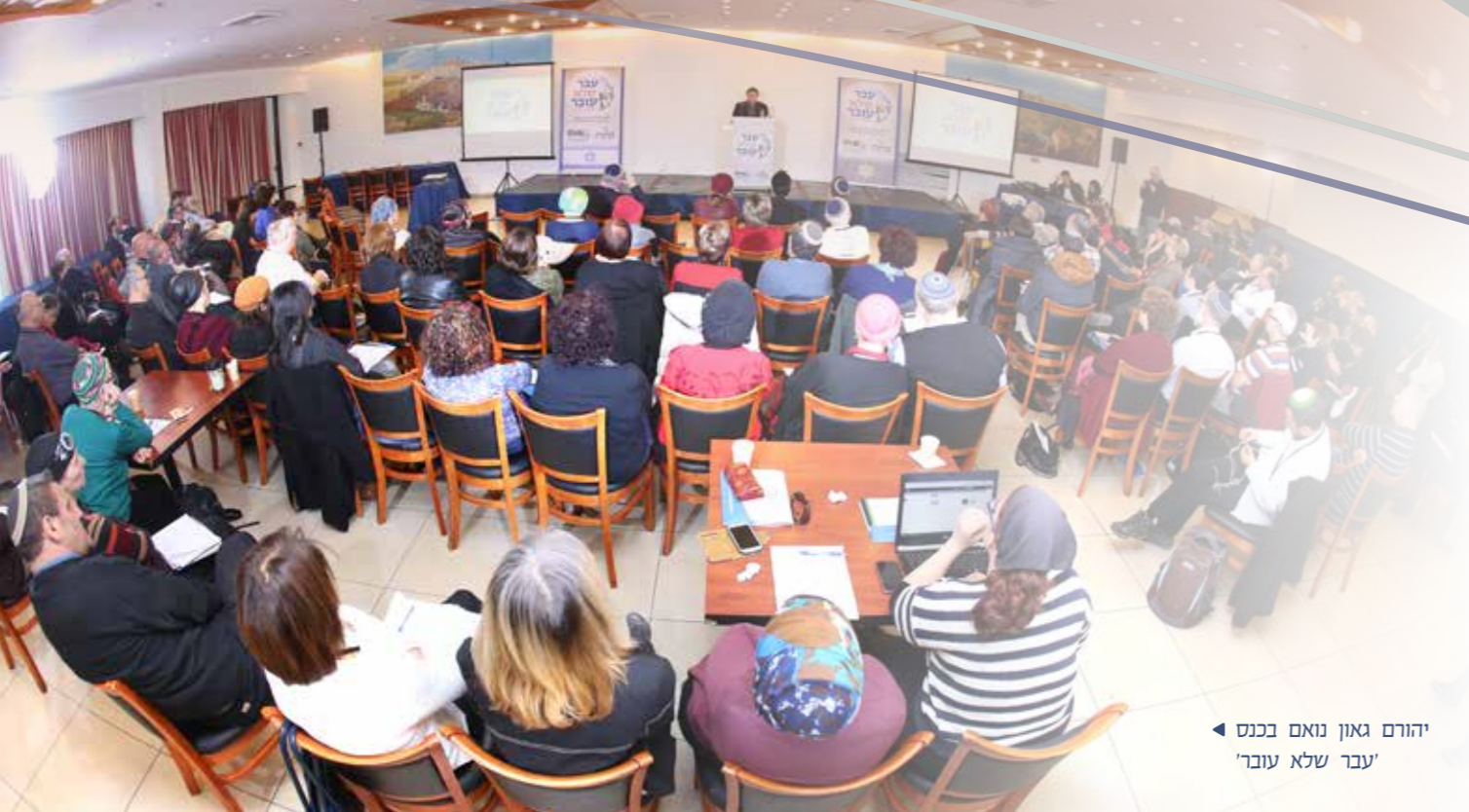
יהורם גאון נואם בכנס 'עבר שלא עובר'